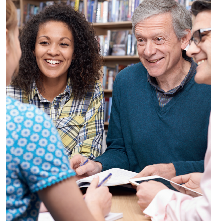
Konzept und Design: kakoi Berlin | Stand: 11/2017

Caritasverband für das Erzbistum Berlin e.V. Bank für Sozialwirtschaft IBAN: DE31 1002 0500 0003 2135 00 BIC: BFSWDE33BER