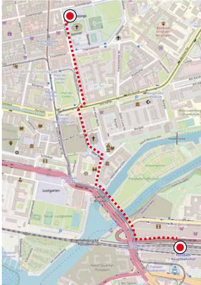
Karte: Open Maps