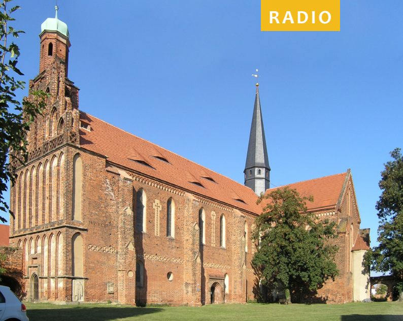
Kloster Marienstern, Mühlberg