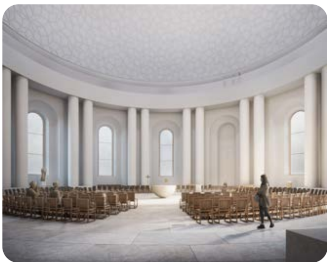
Visualisierung Oberkirche Sankt Hedwig