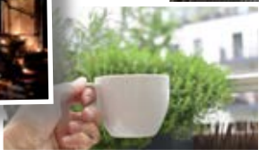
Balkon in Berlin