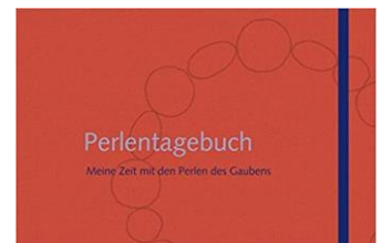
Perlentagebuch: Meine Zeit mit den Perlen des Glaubens ISBN 978-3-87503-147-8